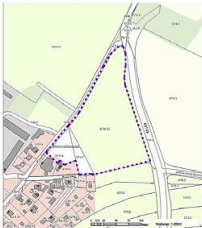
Übersichtsplan Geltungsbereich Bebauungsplan „Campingplatz Struppen“