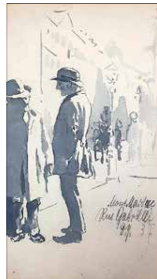
Abb. 1: Robert Sterl, Straßengespräch, 1893, Tinte, Pinsel auf weißem Zeichenpapier, 260 x 158 mm, Robert-Sterl-Haus, Struppen/Naundorf, Z 1060 recto

Gesprächen nachklingen gelassen. Noch bis zum 02. Juli 2023 zeigt die Ausstellung eine Auswahl an Zeichnungen und Gemälden im Robert-Sterl-Haus, die im Rahmen dieser Reise entstanden sind. Zu einem großen Teil werden diese erstmals der Öffentlichkeit präsentiert. Ergänzt wird die Präsentation durch Einblicke in seine damals gefüllten Skizzenbücher sowie Briefe von Robert Sterl und seinem Freundeskreis, welche über das reine Bild hinaus ein Gefühl für den Wert dieser Reise für den jungen Künstler entstehen lassen. Die Ausstellung kann immer donnerstags bis sonntags 9:30 Uhr bis 17:00 Uhr besucht werden. Gruppenführungen sind auch außerhalb dieser Zeiten möglich. Außerdem wird es am Samstag, den 17. Juni 2023, um 10:30 Uhr eine öffentliche Führung durch die Sonderausstellung geben. Darüber hinaus finden - wie immer - Ende des Monats öffentliche Führungen durch das Wohnhaus und Atelier des Künstlers in Struppen/Naundorf statt. Die nächsten Termine sind der 27.05.2023 und 30.06.2023, jeweils um 10:15 Uhr.